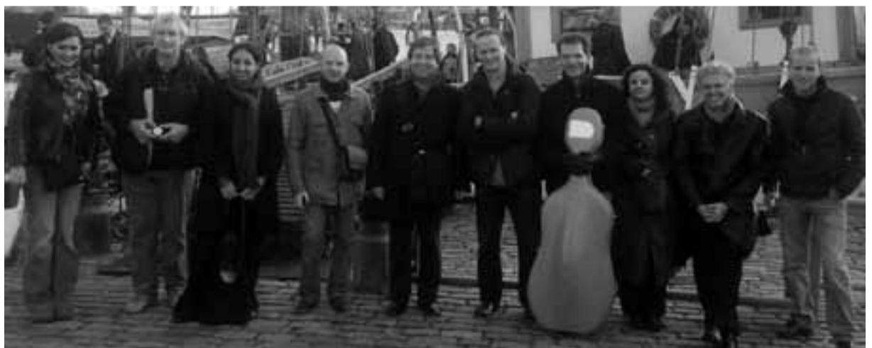
Ensemble TM+ på turne (Helsinki 2008)